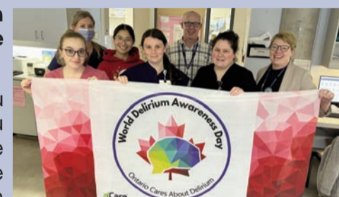
Members of our Medical team (above) and Intensive Care Unit team (below) hoist the flag.

Récemment, nous avons eu l'occasion d'accueillir le drapeau du délirium dans le cadre d'une initiative de sensibilisation reconnue à l'échelle mondiale. Cette dernière favorise un dépistage précoce et des soins plus sûrs pour les patients qui risquent de souffrir de délirium ou qui en souffrent. Souvent causé par de nombreux facteurs, comme une infection, des médicaments ou la perturbation du cycle veille-sommeil, le délirium est associé à un risque plus élevé de complications et à des séjours à l'hôpital plus longs. C'est pourquoi un dépistage et une intervention précoces sont essentiels.